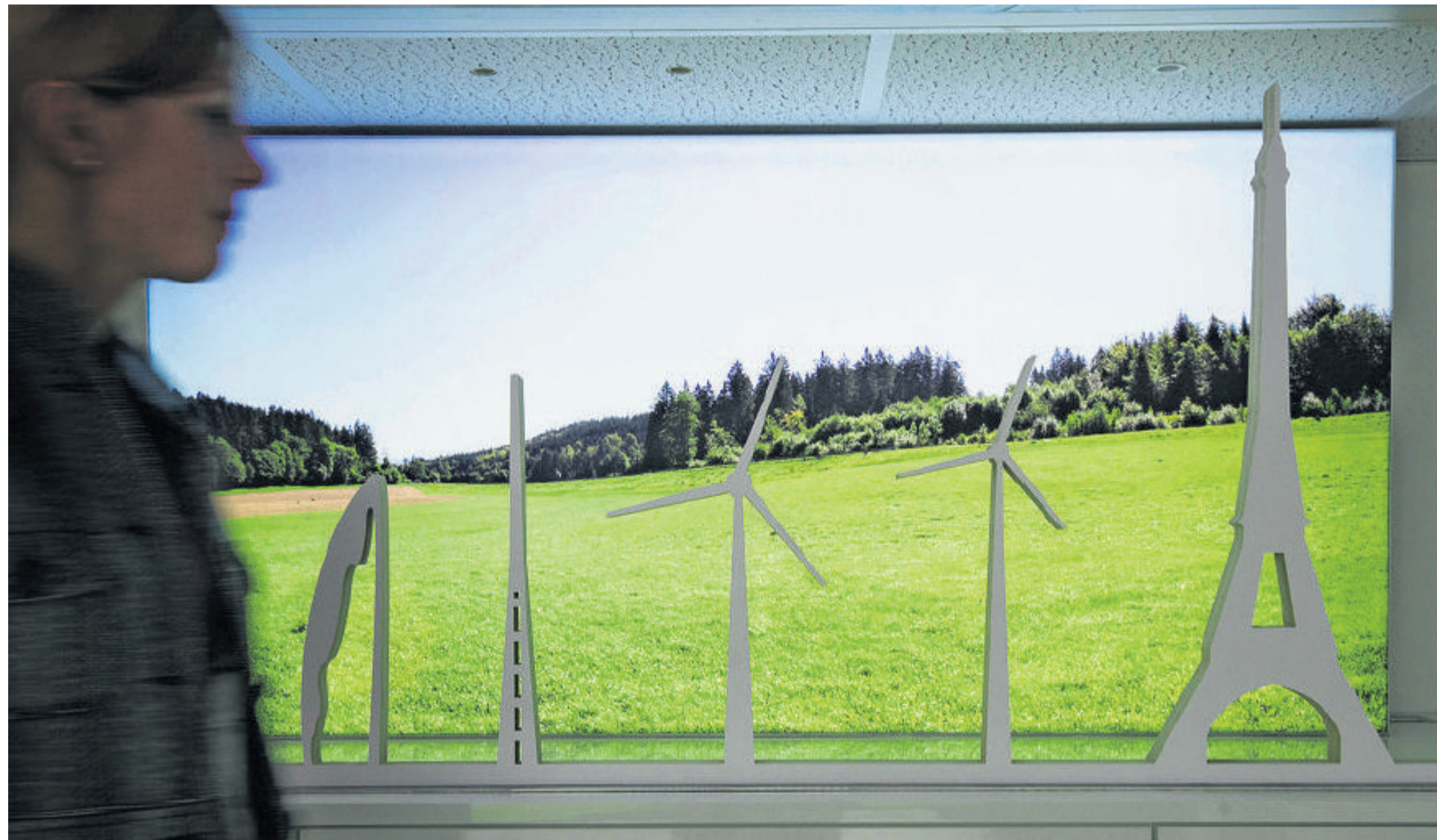
Rien de tel que la tour Eiffel pour se faire une idée de la hauteur des mâts prévus dans les bois du Jorat. La population est invitée à venir s'informer sur le projet EolJorat Sud dans le cadre d'une exposition organisée à l'Espace Contact Energie des Services industriels lausannois (SIL). FLORIAN CELLA

proximité des mâts. Plus on est près, moins on adhère. «Surtout pas au sud!» semble indiquer un autre coup de sonde, réalisé dans les quatre communes visées par le projet EolJorat Nord. Peney-le-Jorat refuse de laisser fleurir une éolienne pile au sud du village, sous les yeux des habitants lorsqu'ils profitent de leur terrasse.